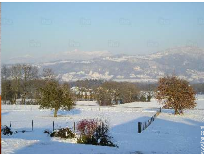
uitzicht op het platteland