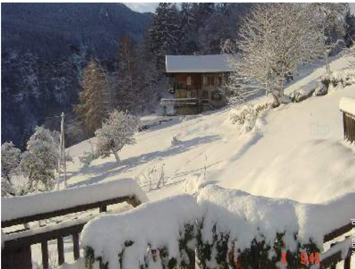
busverbinding met de skipistes