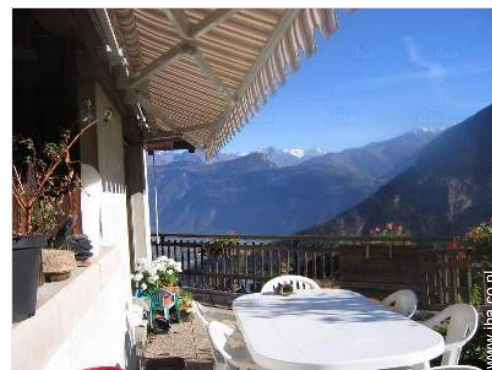
uitzicht vanaf het terras

Dorpscentrum <50m Bushalte/busstation 200m Busverbinding met de skipistes 200m Skiverhuur 1,5km Bakker 1km Kleine winkeltjes 1km Kapsalon 1,5km Postkantoor 1km Bank 1km Geldautomaat 1km Verpleegkundige 200m Ziekenhuis 10km