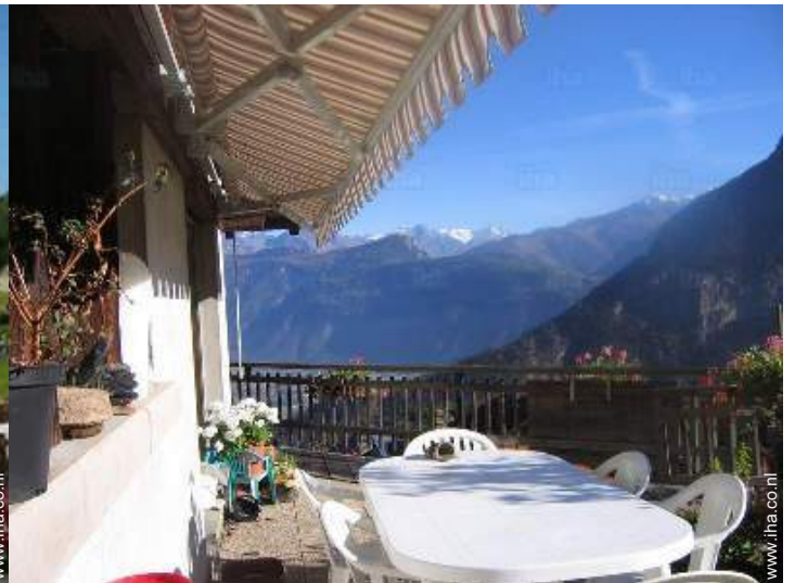
uitzicht vanaf het terras